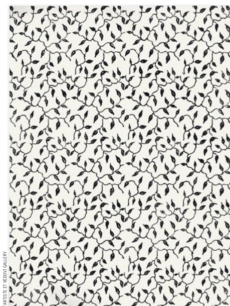
L'ARTISTE ET VEDOVI GALLERY