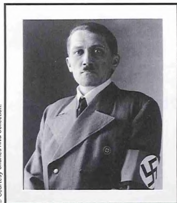
▲ Vlad Monroe, 'Hitler and Jesus', C-print, diptiek.