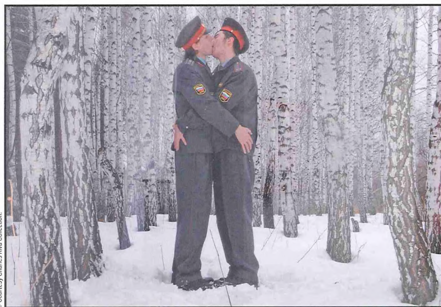
▲ Blue Noses Group, 'An Epoch of Clemency', 2005, C-print, 100 x 135 cm.

Het begin van het verhaal zit in de staart van het parcours. Daar nemen historische