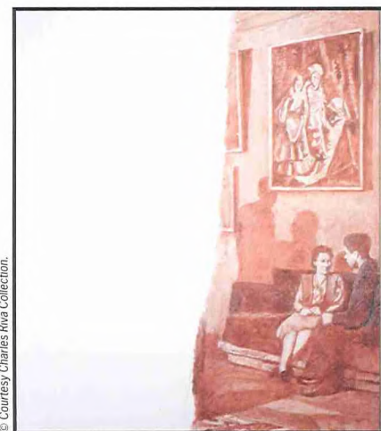
▲ Ilya Kabakov, 'I. Spivak in the club 1996', 2004, olieverf op doek, 239 x 188 cm.

Russische situatie onder de loep nemen. Kritiek en nostalgie naar het verleden gaan hand in hand. Het werk staat met één been in het rijk van de verbeelding en met het andere in de bittere werkelijkheid, al lijkt het een sprookje of een allegorie. Het schilderij van Igor Spivak in de club, een monochroom rood tafereel dat opdoemt uit een witte leegte, komt uit een trilogie over de utopie van de Sovjet-Unie. Eerst borstelde Kabakov schilderijen in naam van Charles Rosenthal, een fictieve schilder die er de komst van het paradijs in zag. Vervolgens zei hij onder zijn eigen naam: 'dit is de hel'. Tot slot verzon hij Igor Spivak, een onervaren schilder die na de val van het Sovjetrijk