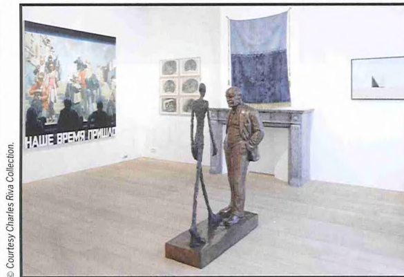
▲ Zaalzicht 'Russian Turbulence'.

'Russian Turbulence'. Tot 3/03, Charles Riva Collection, Eendrachtstraat 21, Brussel, do-za 13-18.30 uur, www.charlesrivacollection.com .