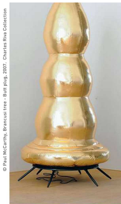
© Paul McCarthy, Brancusi tree - Butt plug, 2007. Charles Riva Collection