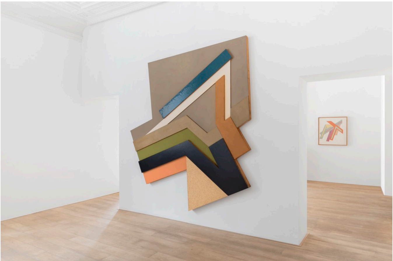
Frank Stella, vue de l'exposition, Charles Riva Collection, Bruxelles, photo Hugard & Vanoverschelde

http://mu-inthecity.com/wp-content/uploads/2017/05/frank-stella-vue-expo-riva.jpg