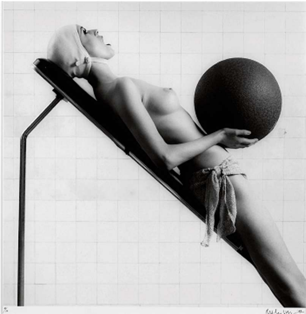
Italian Vogue, 1984

EXPOSITION Robert Mapplethorpe à Bruxelles